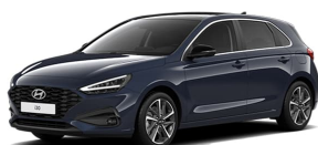
Sailing Blue Pearl