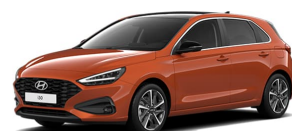
Jupiter Orange Metallic