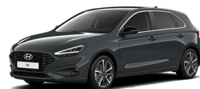
Cypress Green Pearl