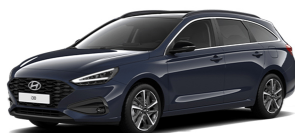
Sailing Blue Pearl