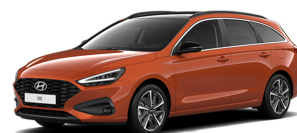
Jupiter Orange Metallic