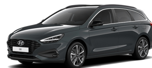
Cypress Green Pearl