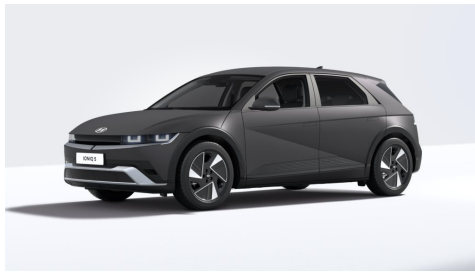
Ecotronic Gray Matte