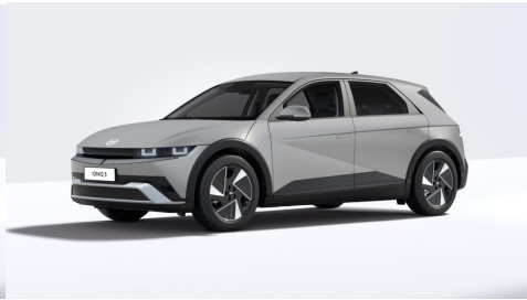
Gravity Gold Matte