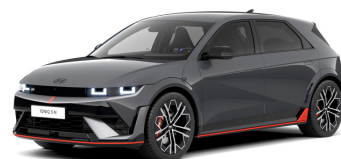
Ecotronic Gray Matte