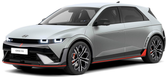
Gravity Gold Matte