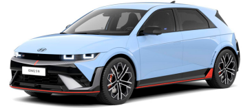
Performance Blue Matte