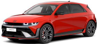
Soultronic Orange Pearl

NB! Pildil kujutatud auto on illustratiivne. Auto varustus, sh katuse, peegli katete, katuseraamide, veljekapslite, tagaakende jne värvus võib muutuda vastavalt auto varustusele.