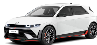
Atlas White Matte