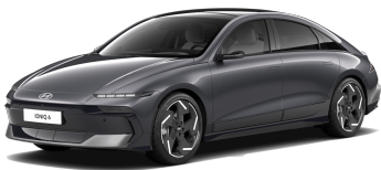
Nocturne Gray Metallic