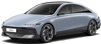
Transmission Blue Matte