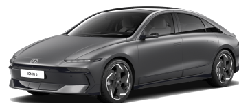
Nocturne Gray Matte