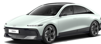
Celadon Gray Matte