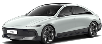
Celadon Gray Metallic