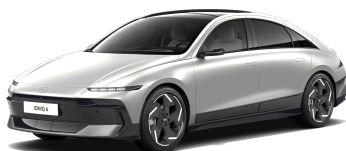
Gravity Gold Matte