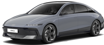
Transmission Blue Pearl