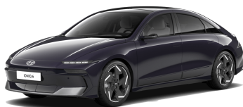
Biophilic Blue Pearl