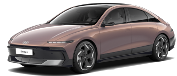
Sunset Brown Pearl