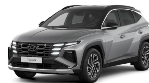
Shimmering Silver/Black roof