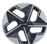
Style 18" (235/55/R18)