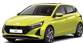
Lucid Lime Metallic