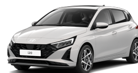
Lumen Gray Pearl