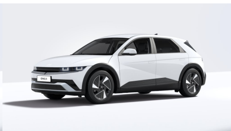
Atlas White Matte