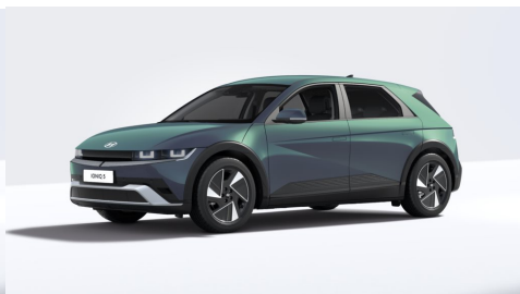
Digital Teal Green Pearl