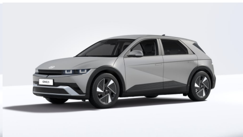
Gravity Gold Matte