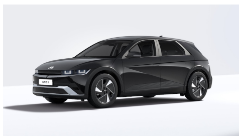
Abyss Black Pearl