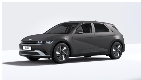
Ecotronic Gray Matte