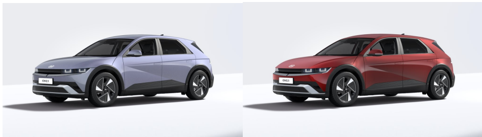
Meta Blue Pearl