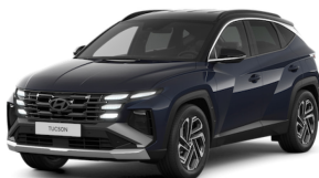
Sailing Blue + Black top