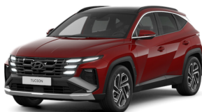
Ultimate Red Metallic

NB! Изображение автомобиля на фото носит иллюстративный характер. Оборудование машины, в т.ч. цвет крыши, корпусов зеркал, релингов, капсул на дисках, задних окон и пр. может изменяться в зависимости от оснащения машины.