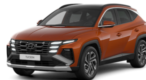
Jupiter Orange Metallic