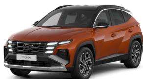
Jupiter Orange Metallic + black roof