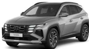
Shimmering Silver Metallic