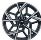
N Line 19" (235/50/R19)