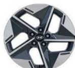
Style 18" (235/55/R18)