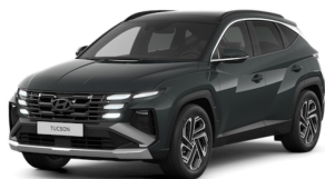
Cypress Green Pearl