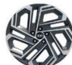
Premium 19" (235/50/R19)

Технические данные, расход топлива и/или энергии, CO 2 автомобиля могут отличаться в зависимости от уровня комплектации автомобиля и условий эксплуатации!