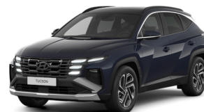
Sailing Blue Pearl