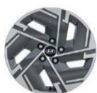
Style 17" (215/65/R17)