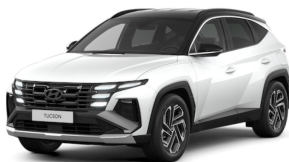
Serenity White/black roof