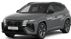
Shadow Gray + black roof