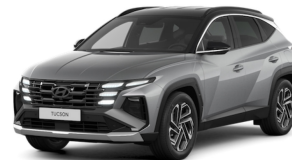
Shimmering Silver/Black roof