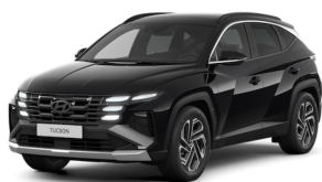
Abyss Black Pearl